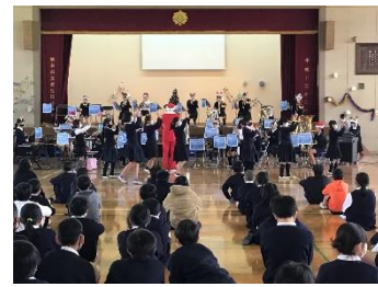
クリスマスコンサート (音楽部)