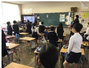
ハーモニー集会 (オンライン音楽集会)