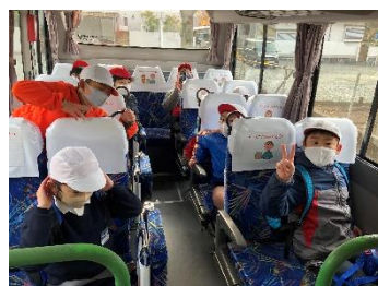
なのはな校外学習 (博物館ほか)