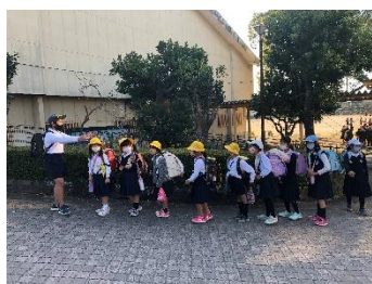
集団下校訓練 (縦割り班)

12月は様々な行事や活動が行われました。詳細は各学年通信等で紹介されています。大切なのは、何のためにそれらを行っているかです。それは、学校経営スローガンである「安全・安心で毎日来たくなる学校（わかる授業、いじめのない学級、仲間と楽しい活動、命を大切にする指導、読書の習慣化）」の具現化のためです。これらの活動を通して「学校が楽しい」と感じる子どもを増やすため、保護者、地域の方の協力を得ながら進めています。