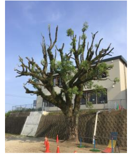
シンボルツリーの楠も夏仕様 ?! 枝を切りさっぱりしました

さて、学校では新型コロナウイルス感染症に対し、未だ予断を許さない状況が続いています。学級閉鎖や行事等の中止については、本当に申し訳ありません。手洗いや校舎内でのマスク着用の徹底、給食時の黙食や放課後の施設の消毒、プール活動・異学年交流の停止など、いろいろと対策を行っているのですが、感染の根絶には至っていません。保護者のみなさんには、子どもたちの学校外での生活に、これまで以上に目を向けていただいて、感染防止に対しタグを組んでいければと思っています。ご協力をお願いいたします。