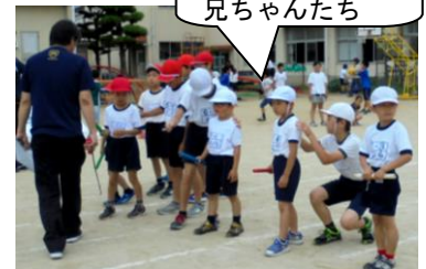
後ろに優しいお兄ちゃんたち

1年生にとっては初めての代表リレー。しかも第1走者。昨日は6年生がコースに連れて行っていろいろ教えていました。優しくて頼もしい6年生ですね。リレーはオープンなので、内側(1コース)に入って走らねばならないのですが、線が引いてあるとなかなか内に入ることが難しいみたいです。何回も練習して、本番はばっちり走れるといいですね。