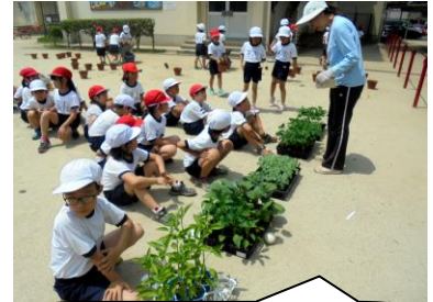
育てたい野菜の苗の前に並びます。枝豆が人気かな？

校の子どもたちはのりがよく、また英語にとっても興味があるみたいで、楽しく活動しています。そして職員自身も運動会前の忙しい時ですが、教師力をアップするために放課後自主研修会を行っています。すべては子どもたちのため、職員も努力を惜しみません。