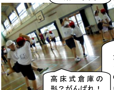
高床式倉庫の形？がんばれ！