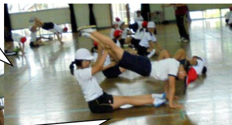
6年生の表現の練習が始まりました。まだまだうまくできません。当たり前です。でもきっと本番に仕上げてくることでしょう。6年の根性を見せてくれ！期待しているよ。お風呂の後はストレッチをするといいね。