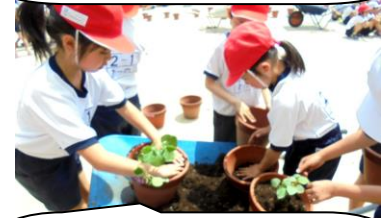
2年生はオクラ、枝豆、ナス、シントウから自分の好きな野菜の苗を選び、鉢に植えかえをしていました。早く育つといいね。