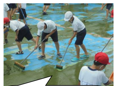
ぬるぬるして気持ち悪かったでしょう。みんなのおかげでプール開きができます。ありがとう。