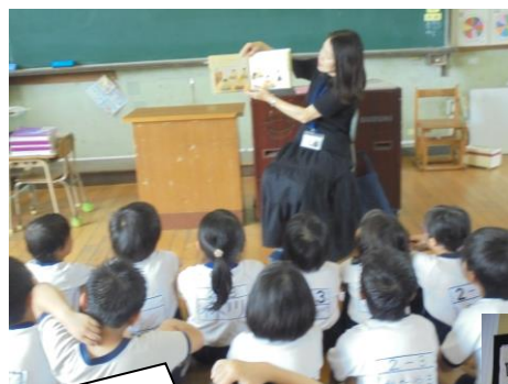
今朝は朝読書。「おはなしの会ひまわり」のお母さま方が2年生に絵本の読み聞かせをしてくださいました。子どもたちは身を乗り出して聞き入っていました。とてもすてきな取組ですね。ありがとうございます。