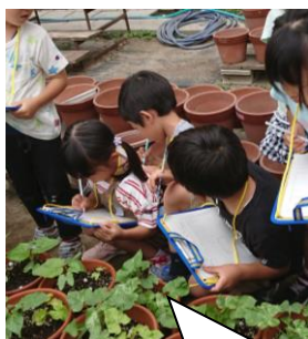
1年生の朝顔の観察をしていました。大きくなって嬉しそう。命を育てることの喜びを感じてほしいな。