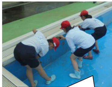
低学年が使う小プールも丁寧に磨いてくれました。低学年が喜びます。ありがとう。

います。全職員で消防署の方の監修のもと研修を行っています。安全に水泳の授業ができるよう、細心の注意をはらっていきます。もちろん授業には必ず水の上から監視するプラス1の教師をつけます。そして子どもたちにも水に入る決まりはしっかり守ってもらいます。決まりを守ることは、自分の命と友達の命を守ることにつながるからです。おふざけは絶対にゆるしません！