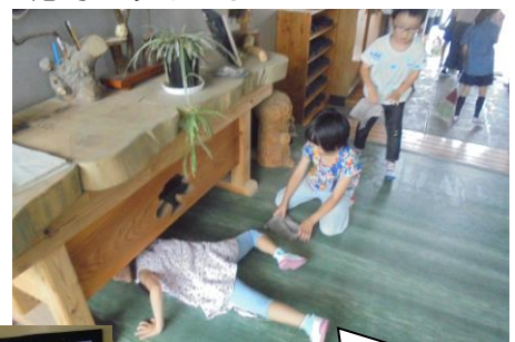
昨日の縦割り掃除。玄関のところを低学年が台の下に潜って隅々までふいてくれました。ありがとう。