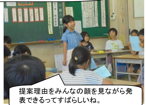
提案理由をみんなの顔を見ながら発表できるってすばらしいね。

学級会の授業でした。議題は「楽しいなかよし七夕集会しよう」です。初めに司会グループさんの自己紹介がありました。次に提案の理由を提案者が前で述べました。その提案理由がすてき♡『3年1組はいろいろな係り活動があってみんなが楽しんでいます。それぞれの係り活動で楽しく遊ぶことはあるけど、まだみんなで一緒に集会をしていません。だから「楽しいなかよし七夕集会」をしたら、みんなで協力するし、もっとなかよくなれるから、学級目標の「みんなで協力！何でもチャレンジ！楽しいなかよし3年1組」に近づけると思います。』と発表しました。そして、