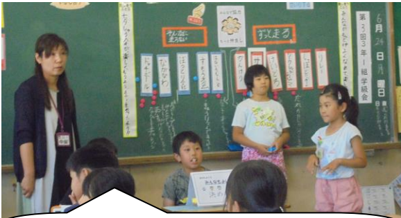
司会グループさんが準備してくれたので、話し合いもスムーズでした。上手にリードできましたね。立派です。

前の会の司会グループさんが、これまでの学級会の振り返りをしました。電子黒板で可視化してあったのでとてもわかりやすくおさらいすることができました。いよいよ協議に入りました。司会グループさんが事前にみんなの意見を集約して、何をして遊ぶかを「ずっと走る」と「そんなに走らない」の2つに分類していました。この2つの分類から遊びを1つずつ決めるのです。たくさんの遊びから2つ決めるよりも、分類してあることで話し合いやすかったです。この分類の視点は、子どもたちのアイディアだそうで、これいいなあと思いました。またよく