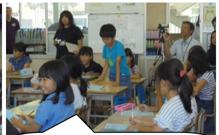
みんなとてもよく発表していましたね。学級目標を常に意識していました。すばらしい！！