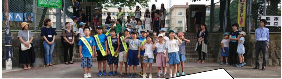
生活委員会の人たちと3年生の子どもたち。正門で元気よくあいさつ運動。活気が溢れていました。保護者の皆様もご協力ありがとうございました。

にできているのも地域の方々の見守りのおかげだと考え、感謝の気持ちを表す一つの方法として「あいさつを大きな声でしよう」ということを学習シートに書いていた人がいました。素敵だなあと思いました。きっと6年生は、自分たちにできることを地域まで広げて考えて行動しているでしょう。今後郷土愛や愛校心を高め、どんなことを考え行動してくれるのか楽しみです。