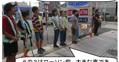
6の3はローソン前。大きな声であいさつをしていました。