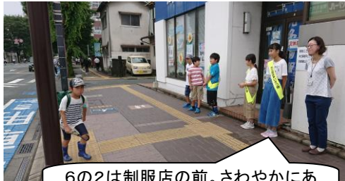
6の2は制服店の前。さわやかにあいさつをしていました。