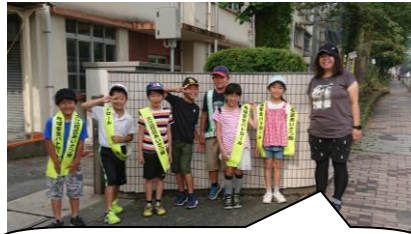
3年生は3つの門に分かれて。明るいあいさつができました。