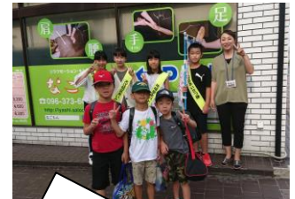
6の1はマッサージやさんの前。笑顔でがんばりました。