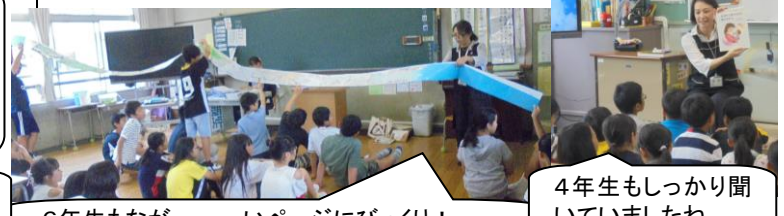
6年生もなが～～いページにびっくり！