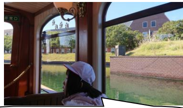
異国情緒あふれる船旅・・・