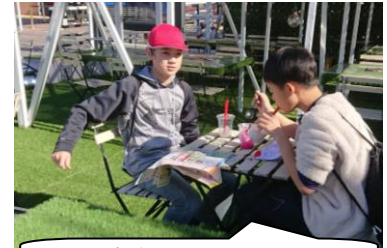
おしゃれなカフェ服。