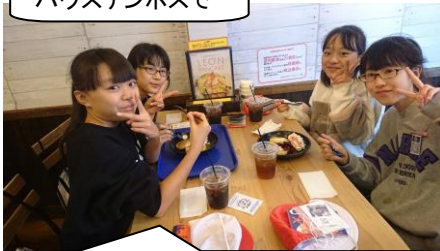
ハウステンボスで