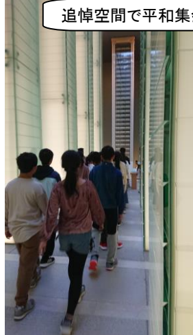
追悼空間で平和集会