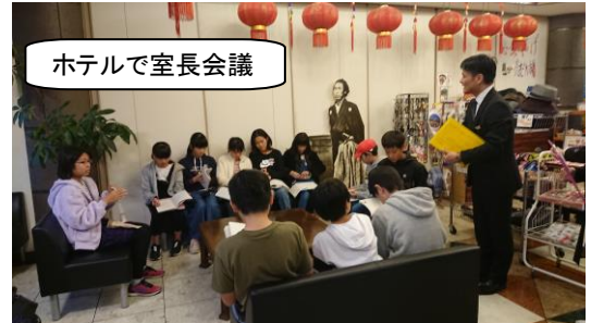
ホテルで室長会議

学校で平和集会での言葉、3つの誓いや歌を練習している時は、ただのセリフでした。しかし、被爆者の方のお話・願いを聞き、しっかり平和学習をした後に行った追悼空間での平和集会では、3つの誓いの言葉や歌に、魂が入りました。だから観衆のみなさんが、皆感動しました。とても素晴らしかったです。これから修学旅行で学んだこと・・・公共のマナーや3つの誓い（優しい心をもつこと、絶対に戦争を起こさないこと、命を大切にすること）、当たり前だと思わず日々の生活に感謝の気持ちをもつことなどを、今度は大江小学校で、身近な生活で、自分でできることを行動にうつすことが大事です。つまり、身近な生活で、行動が変わることが修学旅行の成果です。命を大切に、もっと互いのことを思いやり、それを行動にあらわすことのできる素敵な6年生に成長してくれることでしょう。期待しています！！