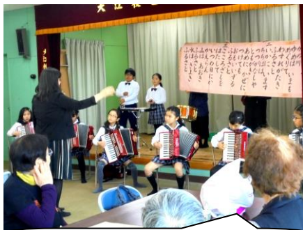
みんな演奏が上手になったね。

土曜日一人暮らしの方々の交流会、いきいきサロンがあり、器楽部のみんなが楽しい演奏を披露しました。とてもあったかい会で、器楽部のみんなは一人一人自己紹介をしたり、曲紹介をしたり・・・一人一役で大活躍をしました。最後に「ふるさと」を演奏し、おばあちゃんおじいちゃん方が一緒に歌っていただきました。ちょっと涙を浮かべている方もいらっしゃいました。私はじ〜んとききました(ウルウル)。演奏が終わって、皆さんのテーブルをまわり、全員と握手。皆さんとっても喜ばれていました。器楽部のみんなの優しい笑顔がとってもすてきでした。