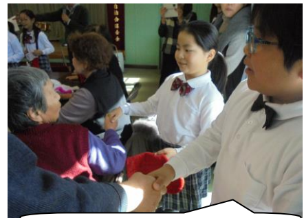
握手。喜んでくださってよかったね

土曜日一人暮らしの方々の交流会、いきいきサロンがあり、器楽部のみんなが楽しい演奏を披露しました。とてもあったかい会で、器楽部のみんなは一人一人自己紹介をしたり、曲紹介をしたり・・・一人一役で大活躍をしました。最後に「ふるさと」を演奏し、おばあちゃんおじいちゃん方が一緒に歌っていただきました。ちょっと涙を浮かべている方もいらっしゃいました。私はじ〜んとききました(ウルウル)。演奏が終わって、皆さんのテーブルをまわり、全員と握手。皆さんとっても喜ばれていました。器楽部のみんなの優しい笑顔がとってもすてきでした。