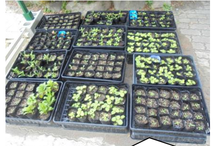
たくさんのポット。これ一つずつ鉢に植え替え大きく育てます。