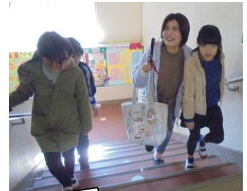
自分たちで教室までエスコート。肘をもってもらって声をかけながら・・・上手でした。