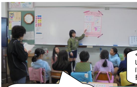
4年生の国語。グループでアンケートをとって、図表を用いたポスターを作っていました。それを分かりやすく報告していました。各班、工夫をこらしたとても見やすいポスターを制作していました。共同作業でうんと力がついてきましたね。

1年生が近頃よく竹馬を練習しています。昼休みに練習していたら教頭先生が補助してくれました。前に進みましたね。よかったね。