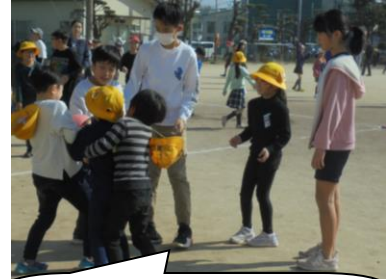
ボールの取り合いをしている1年生を上級生が優しく指導。

先日のたてわり班会議の時のエピソード。「〇〇さんのために、硬いボールはやめて柔らかいボールにした方がいいと思います」とみんなが笑顔で楽しめるような意見がたくさん出ていました。また「鬼ごっことかちりちりばらばらになる遊びに反対です。だって6年生と一緒に遊べる最後のたてわり班遊びだから、みんな固まって遊べる遊びがいいです。」と6年生との思い出をたくさん作りたいという気持ちがあらわれていました。そんな話合いを経ての昼休みの遊びです。争いごとが起きるはずがありません。異学年で遊ぶって、昔は近所での遊びでは当たり前のことだったけど、今はそう体験できるものではありません。異学年集団で学ぶことは、とても意義あることです。大江小の特色ある教育として、これからも続けていきたいです。