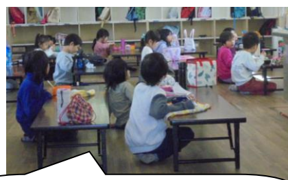
えのきクラブのお昼時間。オルゴールが鳴っていて、みんな黙って前を向いて静かに食べていました。りっぱです。

他の学校では、子どもたちが朝から集団で遊んでいるとか大きなショッピングモールにたむろしているとか、学校に電話がかかってきているところもあるそうですが、大江小はまったくありません。家庭教育力の高さが伺えます。本当にしっかり子どもたちのことを考え支えてくださり、ありがとうございます。さすが大江の保護者だなあとと思います。