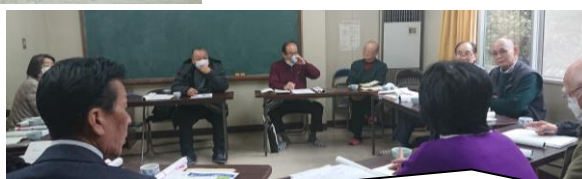
昨日自治会長さんたちの会議に出て学校の現状をお伝えしてきました。会長さんたちは、休校中の子どもたちや保護者のことを、とても心配されていました。ありがたいですね。