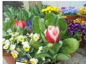
とても美しい花々。チューリップも咲き始めました。