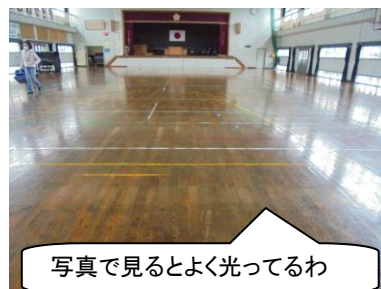
写真で見るとよく光ってるわ

先週金曜日は、体育館のワックスかけをしました。先生方、一生懸命してくれたのですが・・・あんまり大江の体育館の床はピカピカにはなりませんね。(笑)でもちょこっとは光ってます。また、休校前に、5年生がたくさん紅白の紙花を折ってくれていました。各クラスのお祝いメッセージの掲示物も半分くらいできていました。6年生の花道をしっかり飾れるように、職員があとはがんばります。子どもたちが一人一鉢で育てていた花々も、今が一番きれいです。卒業式までその美しさが保てるよう努力します。