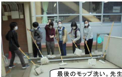
最後のモップ洗い。先生たちもちょっとうれしそう。