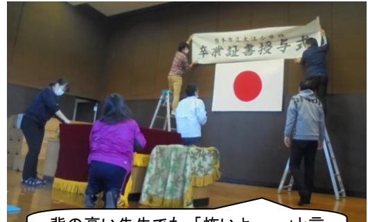
背の高い先生でも、「怖いよ～～」と言っていました。

この1年間、大江小学校をびっぴってくれた6年生が、いよいよ明日、卒業式を迎えます。すばらしい6年生でした。かっこいい6年生でした。6年生は、下学年の憧れのお兄さん、お姉さんでした。五月の運動会。学年一体となった連帯感、そして一人一人に優しさとか力強さを感じました。修学旅行では、フィールドワーク。自分達でめあてを決め、企画・実行しました。ハートフルコンサートでは、最上級生として、表現力豊かなすばらしい演奏を披露してくれました。また、日々の活動も、下学年のお手本でした。委員会活動やたてわり班活動など、しっかりがんばってくれました。突然の休校で、下学年から、私たち職員から、十分な感謝の気持ちを伝えることができず、申し訳なく思っています。本当に素敵な6年生でした。ありがとう。明日は、きっと大江小学校の最後の思い出として、立派な卒業式になると確信しています。お天気も晴れです。そしてあったかい。よかった～。(なぜなら体育館の窓は全開だからです。)新型コロナ感染拡大防止の厳戒態勢の中、時間短縮、内容削減(式辞も超短く)参加者制限、マスク着用等、普段の卒業式とは違いますが、気持ちはいつも以上に子どもたちにあります。子どもたちのことを思い、子どもたち一人一人が輝ける、感動の卒業式にしたいと思っています。