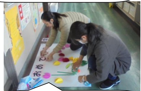
通路を華やかにしようと、先生たちは一生懸命掲示を作っています。