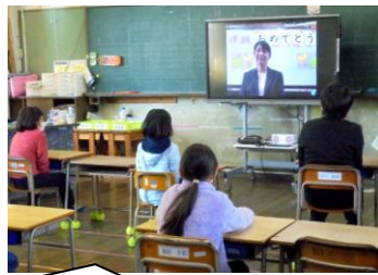
大好きな給食の先生の話をし、しっかり聞いていました。