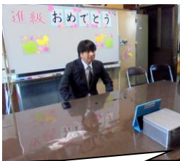
先生方の想いが伝わってきました。グスン

5年生は4月、いよいよ最上級生ですね。学校のリーダーとしてがんばってほしいです。先生たちと一緒にもっと笑顔で明るい大江小にしていきたいです。期待しています。