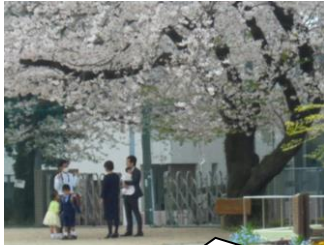
桜の下では、新1年生が何組も記念写真撮影。

4月9日(木) 新2年生から新6年生 4月10日(金) 新2年生から新6年生 4月13日(月) 新1年生と保護者1人 4月14日(火) 全学年 4月28日(火) 全学年 午前中授業 11時半下校