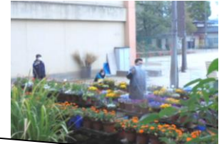
子どもたちがいない分、先生たちがすごくがんばってくれます。お花もきっと子どもたちに眺めてほしいと思っているはずですよ。