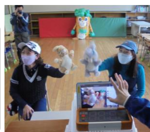
今朝のラジオ体操は2年部。まえせつは人形劇。そうしたら今朝は自分のぬいぐるみを見せてくれた人がたくさんいました(笑)。かわいいね。