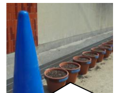
今日は1年の先生方が朝顔の鉢に土入れを行っていました。朝顔の観察が宿題になるようです。植物の生長は学校再開を待ってはくれません。