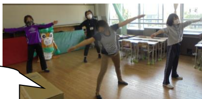
今日のラジオ体操は、4年部の先生方でした。明日はいよいよ最終日です。何年部の先生方かな

お家でラジオ体操をして、ぼちぼち9時から11時半の間に、今後2週間分の学習物を取りに来てください。取りに来るのは、児童でも保護者でもいいです。感染防止の視点から「短時間での来校」「ソーシャル・ディスタンス(2m以上離れる)」をお願いします。