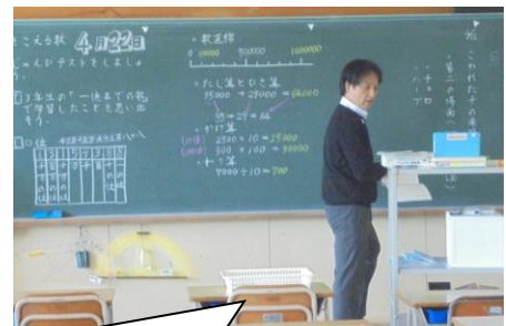
授業スタイルも担任の個性が表れています。子どもたちの反応もよかったです。

4年生にとっては、今日でしばらく遠隔授業とはお別れになります。先生たちは、これからの学習プリントをじゃんじゃん作っていました。そして「毎日子どもたちに会えなくなるのか・・・さびしい」と言っていました。また「学校ではマスクを着けていてなかなか顔を覚えられなかったけど、ZOOMだとお家でマスク無しだからすぐ顔と名前を覚えられました」という声も聞きました。そうですね。マスクで顔の半分以上が隠れている状態では、なかなか特徴がつかめません。4年生は9回、遠隔授業をしましたね。とてもスムーズに楽しく学習できるようになりました。今度は3年生の番です。お待たせしました。3年生も遠隔授業、しっかり取り組み楽しんでね。まずは先生やクラスの友達と仲良くなろう！リラックスして参加してください。