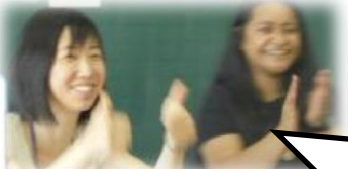
5月21日(木) 5年遠隔授業(Zoom)の様子