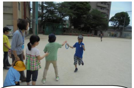
ひまわり1組2組が朝の活動で折り返しリレーをしていました。しっかり走っていました。最後はなんと同時にゴール！勝負は引き分けで喜びました。