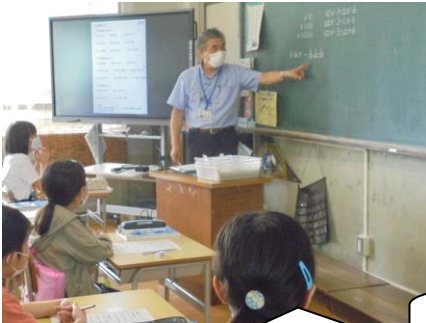
5年生は算数の授業。リモートでない算数授業は久しぶりですね。

やっと始まりますね。全員集合しました。改めて、全校児童665人の子どもたちが、笑顔で活躍する学校を目指していくことを決意しました。大江の子どもたちがこれからの予測不可能な社会を生き抜いていくために、また世界で活躍し、自らの手で幸せに生きていくことができるように、「生きる力」＝「どうにかする力」と捉え、どんなに困難なことに出遭っても、何とかしようとするたくましい心と、思いやりのある優しい心をもった子どもの育成を目指していきます。