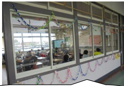
4年生に今日から新しい友達が転入しました。みんなで朝から飾り付けをして歓迎の気持ちを表していました。ステキ♥