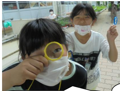
3年生の理科。虫めがねで何を見つけたかな？