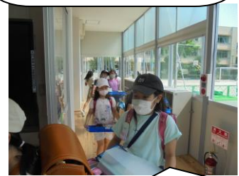
引っ越しは大変だったけど、新しい教室で勉強できるのは嬉しいね。

3組と4組は、新しいプレハブ校舎でお勉強します。自分たちの荷物は自分たちで・・・4の4の子どもたちは、第3校舎の3階から運動場を横断し、プレハブ2階の教室へ。3往復しました。新しい教室で意欲満々。運動場にも一番近いし、気持ちよく勉強や運動にがんばってもらいたいです。