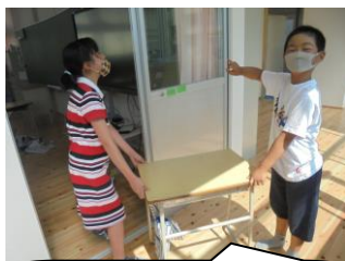
机も二人組で仲良く力を合わせて運んでいました。