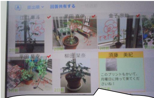
2年生。ロイノートで家で育てているミニトマトの写真を先生に送ることができました。すばらしい！！よくできました。