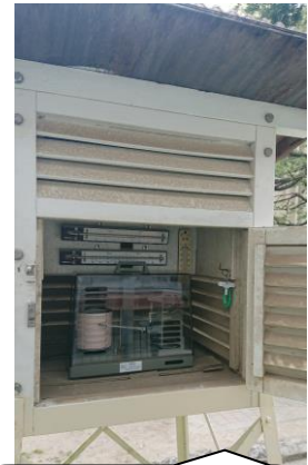
4年生の理科。百葉箱の中です。久しぶりに見ました。晴れの日、曇りの日、雨の日の気温の変化を正確に記録していました。すごいですね。