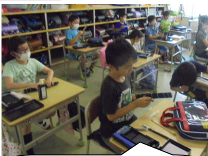
3年生。初めての習字。まずは道具の置き方や名前を知ることから学びました。早く筆を持ちたいね。