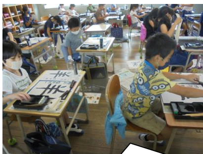
4年生になると、お手本をしっかり見て集中して書いていますね。「羊」と書いていました。