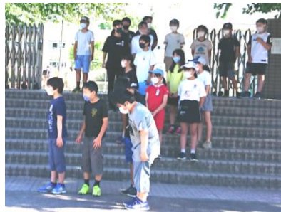
朝のあいさつ運動。クラスで考えたボランティア活動開始。6年生ありがとう