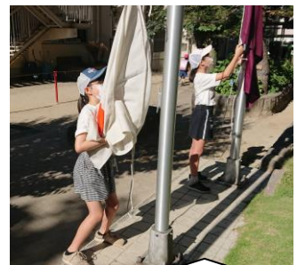
国旗・校旗は旧企画委員会の6年生が自主的に揚げてくれます。