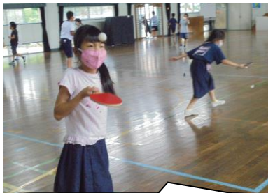
卓球クラブ。まずはラケットとボールに慣れましょう。