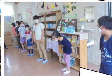
お話クラブ。読書をしたり創作活動をしたりします。未来の作家が誕生するかも