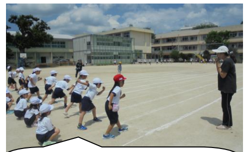
おまけ 1年生はまっすぐ走る練習をしていました。「よ〜い」の姿勢がかっこいいね。やる気満々です。

10月22日、県立劇場にて、内容を工夫して行いたいと計画中です。県立劇場のコロナウィルス感染拡大防止対策に係るチェックリストをもとに、知恵を出し合い、運営の仕方も検討中です。コンサートホールの収容人数は今のところ900人と制限されているので、 子どもたちだけの開催 となります。毎年楽しみにしているお家の方々ごめんなさい。今PTAの執行部の皆さんに、安全な生配信ができないか、記念のDVD作成ができないか等を相談中です。文科省・県立劇場のマニュアル等とにらめっこ・いろいろなところに相談の毎日です。