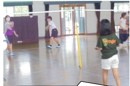
バドミントンクラブ。ラリーが続くようになったら楽しいよね。