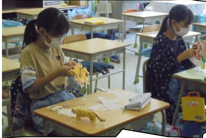
ペーパークラフトクラブ。タイガーでしようか。とても器用ですね。