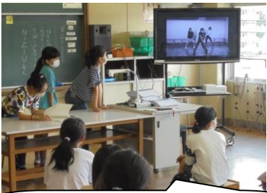
ダンスクラブ。やっぱり韓国のアーティストが人気なのかな？

やっと3密に気を付けながらのクラブ活動を行いました。クラブ活動の目標は、「クラブ活動を通して、望ましい人間関係を形成し、個性の伸長を図り、集団の一員として協力してよりよいクラブづくりに参画しようとする自主的、実践的な態度を育てる。」です。本校の教育目標実現には、なくてはならない主体的な活動です。子どもたちも大好きな時間です。学年や学級の所属を離れ、4年生以上の同好の児童をもって組織するクラブは、異年齢集団の交流を深め、共通の興味・関心を追求する活動です。主に①クラブの計画や運営 ②クラブを楽しむ活動 ③クラブの成果の発表を年間を通して行います。本年度は、①卓球 ②クラフトペーパー ③消しゴムはんこ ④マンガ・イラスト ⑤バドミントン ⑥昔遊び ⑦室内ゲーム ⑧ipad ⑨お話 ⑩屋外スポーツ ⑪手芸 ⑫折り紙 ⑬地域探検 ⑭ディベート ⑮ダンス ⑯演劇 というバラエティーに富んだクラブ内容で募集をしました。保護者の皆さんが小学生だったらどのクラブに入りたいですか？迷いますね。先週は計画を立てたクラブもあるし、実動したクラブもあります。6年生を中心に、本年度も子どもたちの主体的な計画・運営・楽しい活動になることでしょう。(写真は私が出張だったので川上主幹にとってもらいました。)