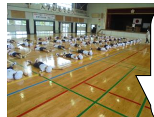
おまけ 1年生が体育館で体育をしていました。ラジオ体操を笑顔で。綺麗な床にゴロンとしました。