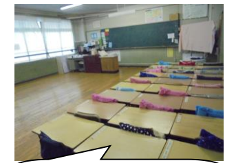
窓から離れたところで何でも避難させました。