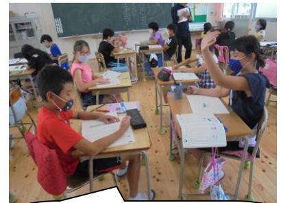
対面式で学び合いをすると、授業も楽しいよね。のってきます。

先日、4年生がグループ学習をしていました。机と机の間をちょっと空けてのグループ学習。これ、いいなあと思いました。「1メートル」を工夫して作っていますね。どうしても子どもたちは熱中すると密になります。夢中になって頭と体をくっつけてお友達に話しかけます。休み時間もそうです。でも必ず「離れて！」っと、誰かが注意している光景をよく目にします。えらい！！近頃、ついつい忘れがちな「3密」。子どもも大人も今一度気を引き締めなおして、感染拡大防止に最善を尽くしていきたいと思います。