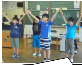
「はじめようコンサート」チームと「クイズ」チームです。4人の息がぴったり合っていましたよ。昼休みに練習したのでしょうか。表現の仕方がとてもよかったです。