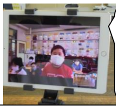
感想を言ってくれた2年生と5年生。ありがとう。お返しがあると、どのように伝わったかが分かります。発表した人たちがやってよかったなあと思います。