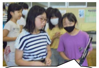
教室のみんなの様子がきになりますよね。どの学年もしっかり聞いてくれました。