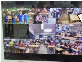
ちゃんとみんなのクラスの様子は見えていますよ～。音楽委員会さんに大きな拍手、ありがとうね。