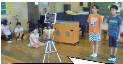
集会委員さん。司会、初めの言葉、終わりの言葉など役割をきっちり果たしていますね。堂々と自信をもって回を重ねるごとに上手になっていますね。