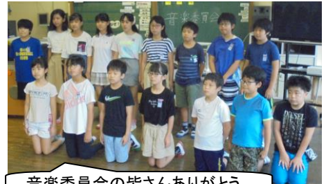
音楽委員会の皆さんありがとう。

毎週水曜日の朝は、とても楽しみです。それは集会活動があるからです。Zoomを使っただけの集会活動になって、何回目の集会でしょうか。今日は音楽委員会の発表でした。スタジオは、今回は音楽室を使用しました。まず集会委員会の始まりの挨拶と内容紹介、そして音楽委員会の発表と流れがスムーズでした。音楽委員会からは、10月22日のハートフルコンサートに向けての提案。いつもオープニングで歌っている「はじめよう コンサート」という曲。今年は思いっきり歌える状態ではないので、振り付けをがんばります。ニューバージョンを披露してくれました。また音楽委員会クイズもありました。音楽委員会が日頃どんな仕事をしているのか、3択or 4択で教えてくれました。その後、今回は5年生と2年生の教室に画面が切り替わり、感想交流をしました。2年生が「ハートフルコンサートに向けてがんばろうという気持ちになりました。」と返してくれて、とても嬉しかったです。音楽委員会のみんなのねらい通りでしたね。「意図をもって、相手に伝わるように表現する力」「みんな協力して1つのことを成し遂げる力」がついてきました。この朝の児童集会は、みんなでよりよいものを創ろうと力を合わせ、練習を重ね努力しそして表現することで、成果や成長を子ども自身が実感できる、子どもたちにとってとてもよい体験です。委員会の発表は、下学年の人たちのお手本になります。今後もこの集会は、本校の特色ある教育活動の1つとして、大事にしていきたいです。