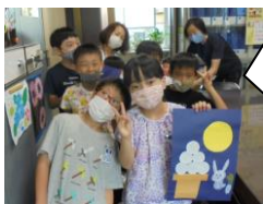
おまけ ひまわり組さんが「お月見」を作成して校長室に飾ってくれました。ありがとう。秋を感じますね。

今年はリモート研修。たっぷり学びました。私たちもコロナがあったからこそZoomも使えるようになり、遠隔での研修・・・今までにない方法で研修を体験することができました。昭和の時代からするとすごい進歩だ！（笑）今職員会議もリモートでやっています。教職員もリモートの利点とそうでない点を実感しています。