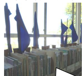
6年生の表現は旗を使うみたいね。密にならないダンスでナイスだよ