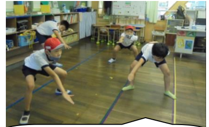
ひまわり学級でも「ソーラン節」の特訓が始まりましたよ。

保護者の皆様には、リボンを後日配布します。今年は当日準備係さんの活躍の場が少ないので、このリボン、準備係さんに作ってもらおうと思っています。3人お子さんがいたら3本のきれいな色のリボンを名札につけて来てくださいね。他の学校では不正防止からリボンに学校名の印鑑が打ってあったり、校門で体温チェックがあったりしたとか・・・私は大江小の保護者の皆さんには必要ないと思っています。感染拡大防止の1番は、一人一人の意識の高さです。今年は特別な運動会になります。子どもたちの心は、とても純粋です。きっといつもとは違うけれどいつもより気持ちのこもった運動会になると期待しています。