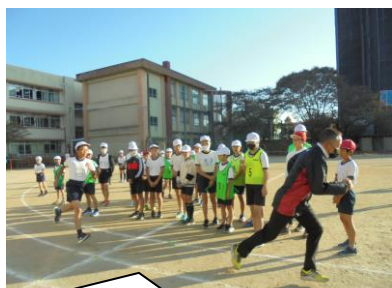
リレーの朝練。 高学年はお手本になるようなかっこいいバトン渡しを特訓中。