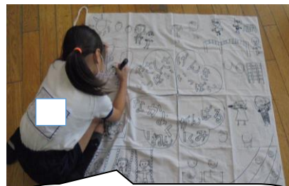
1年生の学級旗。 このクラスは全員が自分の絵を旗に書いていました。どのクラスもクラスの特徴が出ています。