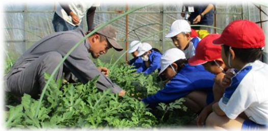
3年生のスイカの受粉。生きた学習です。 JA 青年部の皆さん、お世話になります。 （総合的な学習の時間）