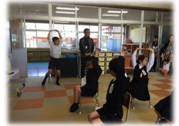
あじさい学級の授業参観。 発表も上手でしたね。

学校といたしましては、こういった授業参観日や「田原小の日」における授業公開、運動会や学習発表会、地域、保護者の皆様において頂く各行事等において、頑張る子どもたちの姿をお見せしたいと考えております。これ以外にもいつでも参観いただけますので、お気軽に学校にお越しください（お手数ですが、その際は職員室までお声かけをお願いいたします。）。