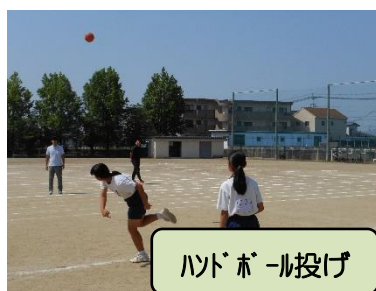
ハンドボール投げ