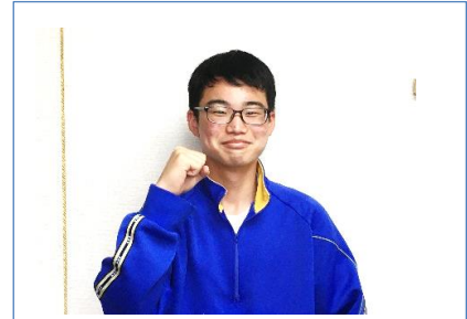
団長としての経験を

～経験は人を変えます。体育大会を通して、この3人のリーダーたちもまた一段と成長してくれることでしょう。期待しています。