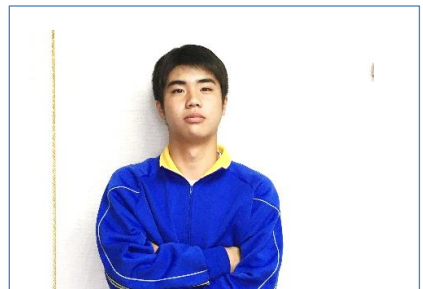
成長のステップに！

保護者の皆様へ。SNSによるトラブルが全国的に頻発しているようです。毎日とは申しませんが、少なくとも週1回は子どもさんのスマホをチェックしてあげてください。子ども達を、スマホによるトラブルの被害者にも、加害者にもしたくありません。どうかご協力をお願いします。学校と家庭で力を合わせて、子ども達を守りましょう。