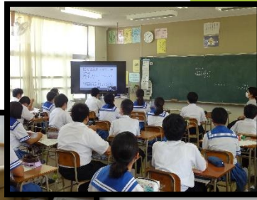
③教室で映像を見つめる生徒たち