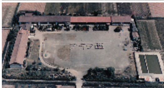
旧校舎（昭和四十九年頃） パノラマ写真と航空写真