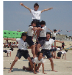
二十一年度運動会 五月三十日