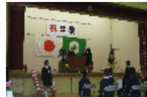
21年度卒業式 22年3月24日 *卒業生16名