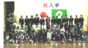
22年度入学式 22年4月12日 *入学児童28名