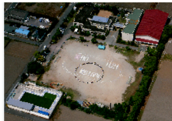
現校舎と校地（110周年記念 平成21年5月撮影）