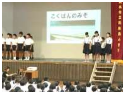
美化委員会による発表の様子(4つとも花丸になるように)