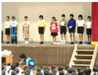
集会委員によるドラえもんの劇(題をつけるとしたら、【自信を持つことは大事】