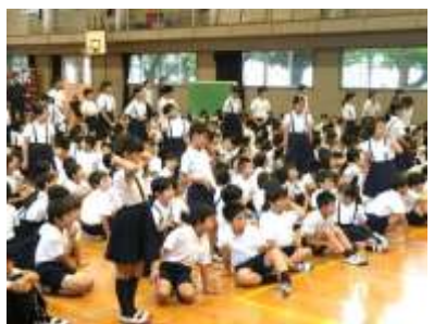
6月生まれの人がたくさんいました。こちらはインタビューの様子

を言って、この日の子ども集会は終わりました。練習時間もそんなに無いのに、美化委員会の発表や集会委員会の劇など堂々と人前で発表していて、よくここまでできたものだと感心しました。お疲れ様でした。