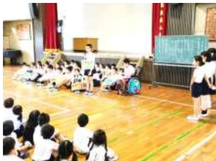
各委員会の委員長さんが発表