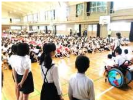
司会・進行は集会委員の皆さん