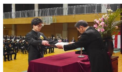
卒業証書授与(5組代表)