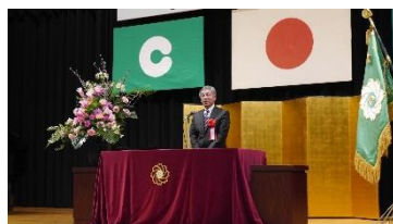
祝辞(熊本市副市長 多野春光様)