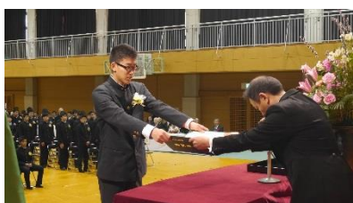
卒業証書授与(1組代表)