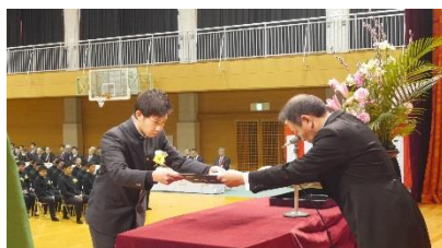
卒業証書授与(2組代表)