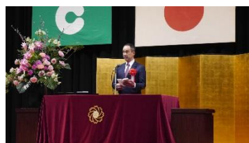
祝辞(熊本市議会議長 澤田昌作様)