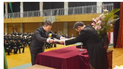
卒業証書授与(3組代表)