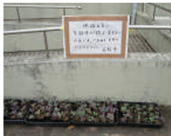
地域への呼びかけ