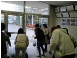
子どもフォーラム での様子