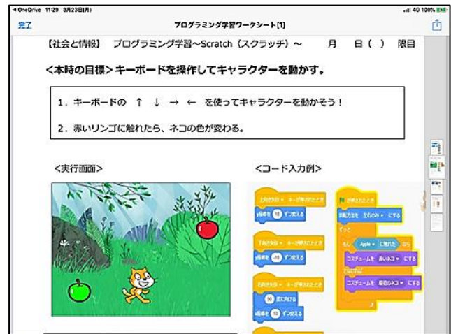
図4 授業の流れが分かるワークシート