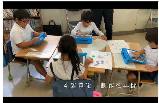
図3 授業の流れが分かる動画