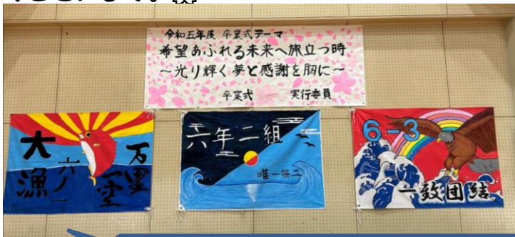
卒業式テーマと6年生各クラスの旗です。

修了式は体育館で行いました。修了証を各学年の代表の子どもに私から手渡しました。これまで修了式がオンラインで行われていたため、このことも4年ぶりのことでした。修了証は「みなさんの成長、各学年で学業を達成したことを喜ぶ大切なもの」と話しました。式の中で1・3・5年生の代表の子どもが意見発表をしました。「漢字の学習を頑張った」「運動会が思い出に残っている」「国語の授業で『相手の伝えたいことを引き出す』ことに取り組んだ」など学校教育目標にある「考えよう」「チャレンジしよう」「つながり合おう」を意識して行動したことを嬉しく思います。ご家庭でも子どもたちの頑張りを親子で分かち合ってください。よろしくお祈りします。そして子どもたちには1年間頑張った「今の自分」を新しい学年に向かう「これからの自分」に更にパワーアップさせることを願っています。