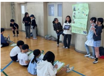
秋津小で若葉小3年生が発表