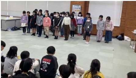
若葉小で「秋津のイイね！」を紹介

総合的な学習の時間は、知識の習得だけでなく、「考える」「つながる」「挑戦する」といった“生きる力”そのものを育む貴重な学びです。こうした経験の積み重ねが、子どもたちの将来に向けた大きな成長につながると考えています。