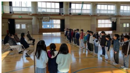
一人一人の学びを伝えました