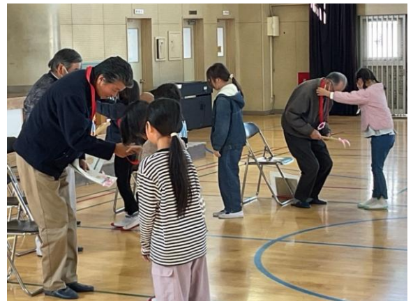
お礼のメダルとお手紙を渡しました