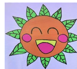
麻生田小キャラクター 「アッサニー」