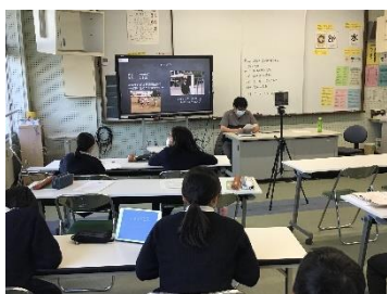
歯の健康について (学校保健員会)