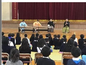
箏と尺八のコンサート (文化庁巡回公演)

12月は様々な行事や活動が行われました。詳細は各学年通信等で紹介されています。大切なのは、何のためにそれを行っているかです。それは、学校経営スローガンである「安全・安心で毎日来たくなる学校(わかる授業、いじめのない学級、仲間と楽しい活動、命を大切にする指導、読書の習慣化)」の具現化のためです。これらの活動を通して「学校が楽しい」と感じる子ども増やすため、保護者、地域の方の協力を得ながら進めています。