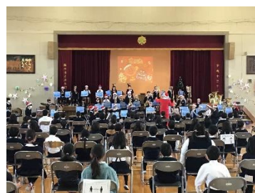
クリスマスコンサート (音楽部)