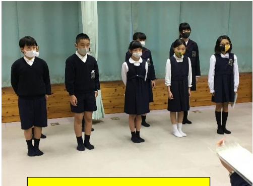
保健委員会のみんな

「自分の命は、自分で守る」五福小「みんなでがんばること」につながる発表内容ですね。みなさんも「けが マップ」をよく見て、十分気を付けながら生活してほしいと思います。けがの原因は、「廊下を走る」ことからが多いようですよ。