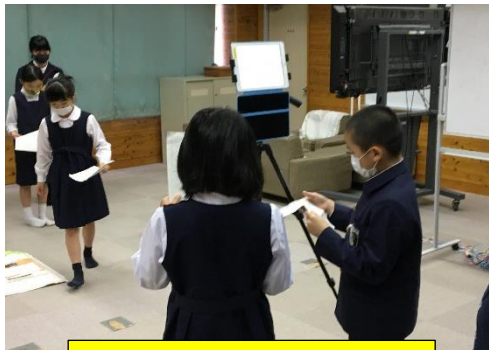
ipad を操作しながらクイズを出します