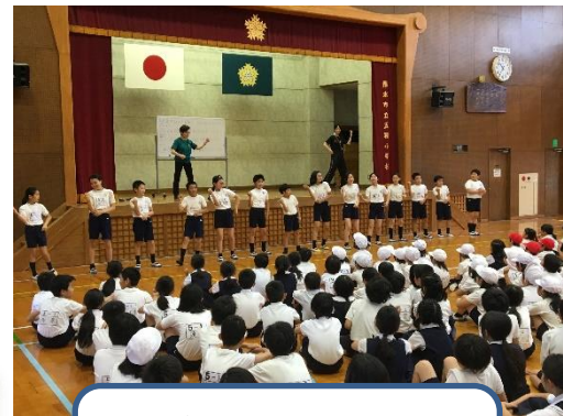
応援団が見本を みせます