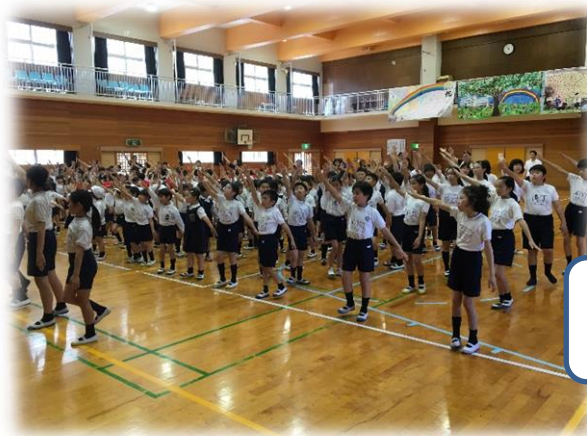
全校児童で練習です