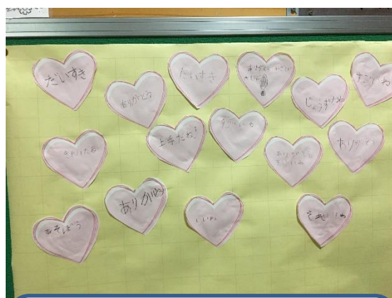
ハートの中に書かれた 『うれしい言葉』