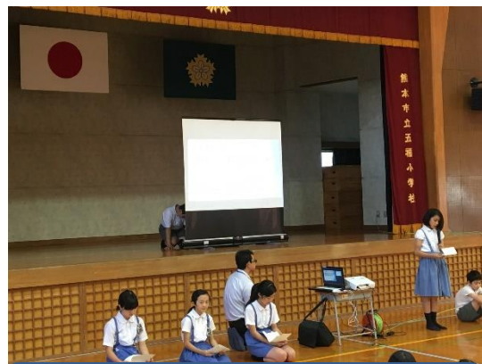
生活委員による「生活朝会」