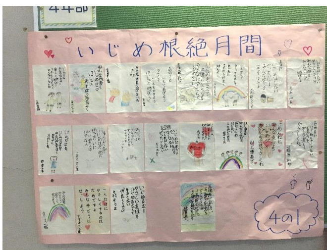
4年生が取り組んだ人権標語