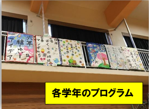
各学年のプログラム