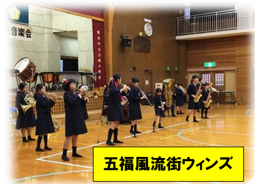
五福風流街ウインズ