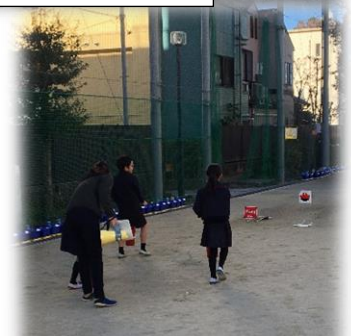
子どもたちの代表も消火器 の訓練