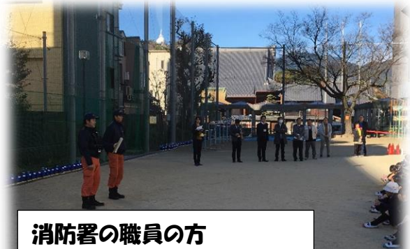
消防署の職員の方 交流センターの職員の方も