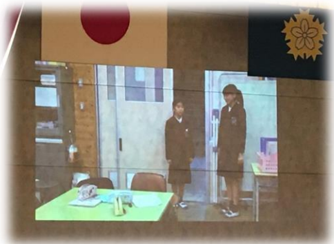
保健室の利用の仕方について