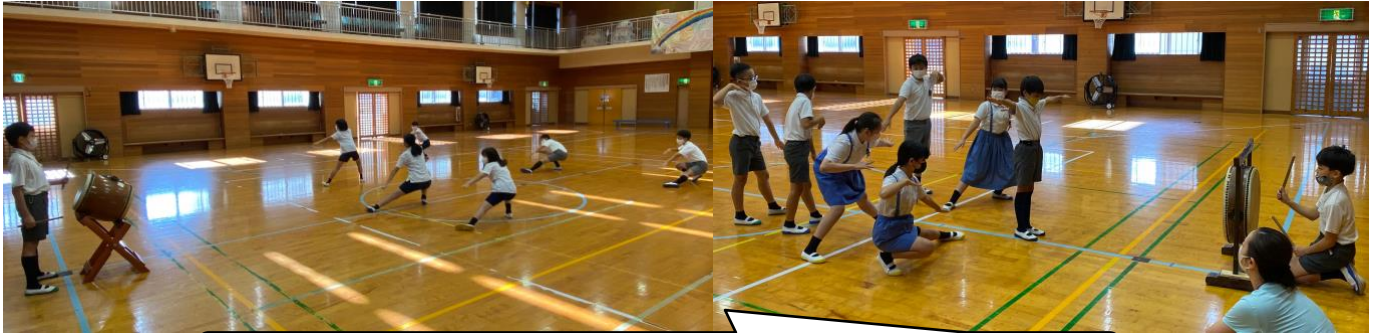
6年生が早く覚えて5年生をリードしていきます。期待しています！頑張ってください！

6年生はすでに朝と昼に応援団の練習をしています。来週から5年生も入って本格的に練習が始まります。6年生には教頭先生から保護者の方にみに来てもらえるということ伝えてもらいましたが、子どもたちみんなとても喜んでいただいているということです。日頃から6年生はあらゆる面で学校のリーダーとしての働きをしてくれています。運動会を通してさらに逞しく成長してほしいと思っています。小学校最後の運動会を思い出に残るものにしてほしいです。お昼休み、屋上で練習しているのを見ると、「当日まで声もつかな」と心配になるくらい気合が入っています。